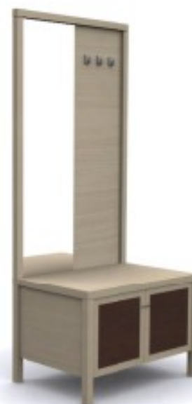
m6 panel z wieszakami, lustrem i szafką na bagaż 88/ 60/ 204H