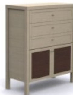
m14 komoda 88/ 40/ 107H