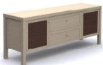
m12 komoda RTV 152/ 40/ 59H