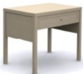
m1 biurko 88/ 60/ 74H