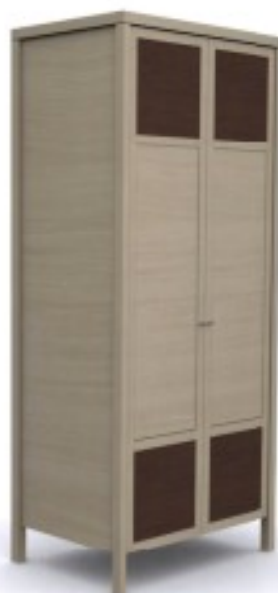
m5 szafa 2-drzwiowa 88/ 60/ 204H