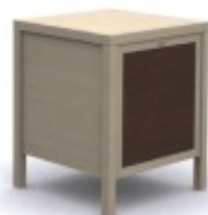
m2 minibarek 60/ 60/ 74H