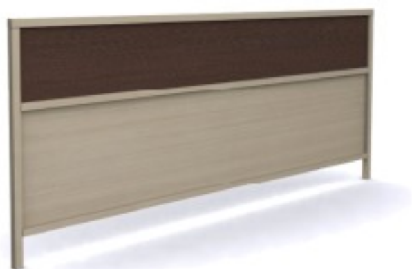
m7 panel za łóżko 140/ 4/ 120H 280/ 4/ 120H