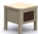
m8 szafka nocna 30/ 35/ 42H 40/ 35/ 42H