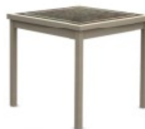
m16 stół jadalniany 80/ 80/ 74H