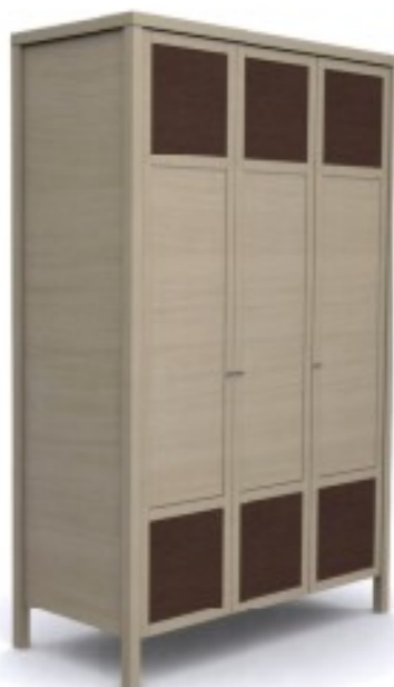
m4 szafa 3-drzwiowa 128/ 60/ 204H