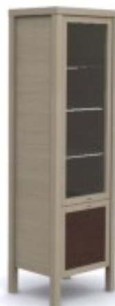
m15 witryna 48/ 40/ 164H