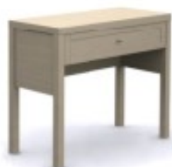
m13 toaletka 88/ 40/ 74H