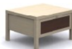
m9 stolik 72/ 60/ 42H