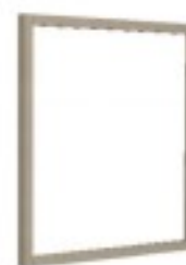
m3 lustro 88/ 88H