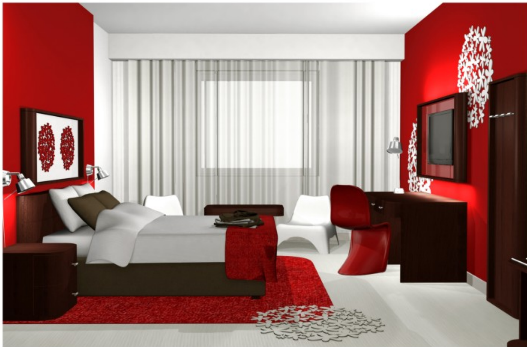
camelia harmonijna kompozycja linii i detali