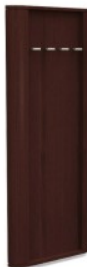
C5 panel z wieszakami 60/ 192H