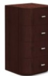
C4 komoda wysoka 40/ 40/ 97H