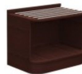
C3 szafka na bagaż 80/ 65/ 60H