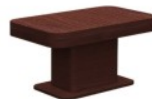
C9 stolik 80/ 60/ 50H 80/ 100/ 50H