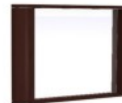
C11 lustro nad biurko 100/ 60H