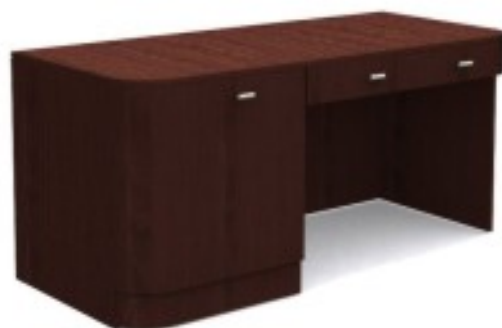
C1 biurko z minibarkiem 145/ 65/ 74H