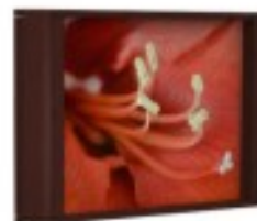
C10 rama obrazu 100/ 60H