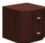
C8 szafka nocna 40/ 40/ 45H