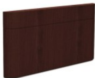
C7 panel za łóżko 110/ 12/ 85H 155/ 12/ 85H 200/ 12/ 85H 290/ 12/ 85H