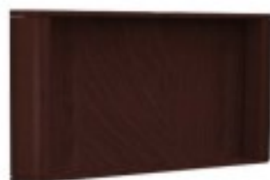
C3 panel RTV 100/ 12/ 80H 120/ 12/ 80H