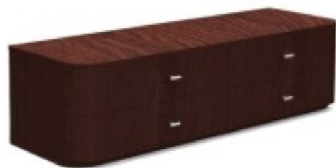
C2 komoda RTV 150/ 50/ 50H