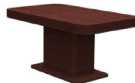
C5 stół jadalniany 80/ 120/ 72H