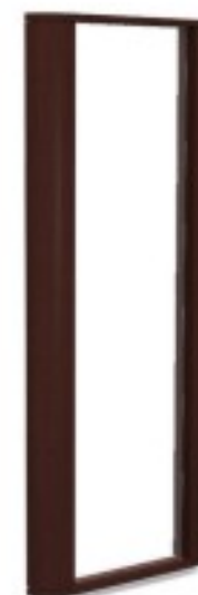
C6 panel z lustrem 60/ 192H