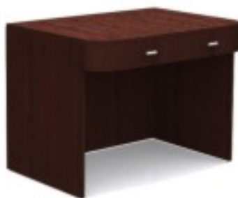
C2 biurko 90/ 65/ 74H 100/ 65/ 74H 110/ 65/ 74H