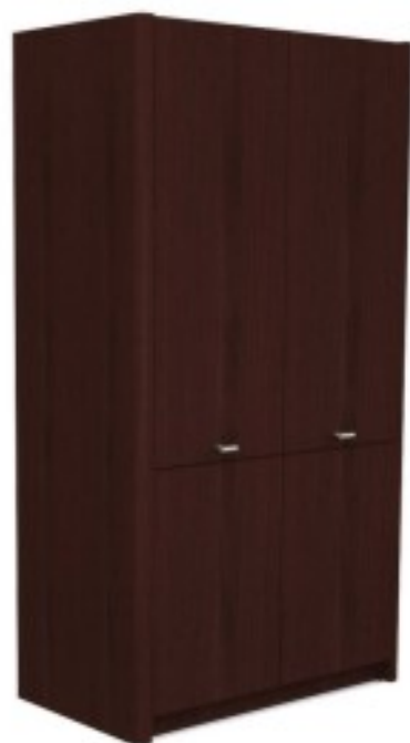
C4 szafa hotelowa 100/ 60/ 200H 120/ 60/ 200H